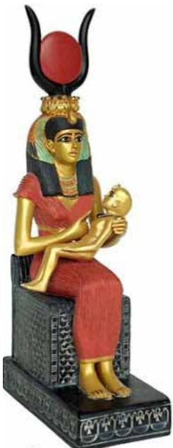
ISIS with HORUS

ஆண்பிறந்தது போலவே, இன்றும் ISIS இயத்தினால் ஆண்டவரின் பிள்ளைகள் கொன்றுபோடப்பட்டு, பெண்கள் சீரழிக்கப்படுகின்றார்களே. ISIS என்ற சொல்லின் சத்தம் ISIS தேவதை செய்யும் இக்கடைசிகால யுத்தத்தையே நமக்கு முன்நிறுத்துகிறது. உலகில் பிரபலங்கள் பலர் ISIS என்பதை தங்கள் பெயராக சூட்டிக்கொள்வதும், இந்தியா உட்பட பல்வேறு தேசங்களில் இத்தேவதையின் கணவனாகக் கருதப்படும் பாகால் வணக்கத்திற்காகக் கூம்பு வடிவ கோபுரங்கள் கட்டப்பட்டிருப்பதும், நியூயார்க் மற்றும் லண்டன் போன்ற இடங்களில் இத்தெய்வங்களுக்குக் கோவில்கள் கட்டப்பட ஆயத்தப் பணிகள் நடைபெற்றுவருவதும் இறுதிகால எச்சரிப்பின் செய்தியே. அஸ்தரோத், சிம்ராயிஸ், இஸ்தார், ஈஸ்டர் (Easter) போன்ற பிற பெயர்களுடனும் இத்தேவதை அழைக்கப்படுகிறது. முழு உலகையும் தன்பக்கமாக வளைக்க நினைக்கும் இவ்விரு சொற்களும், உலகின் இறுதியையே சொல்லி எச்சரிக்கிறது என்பதே உண்மையான செய்தி.